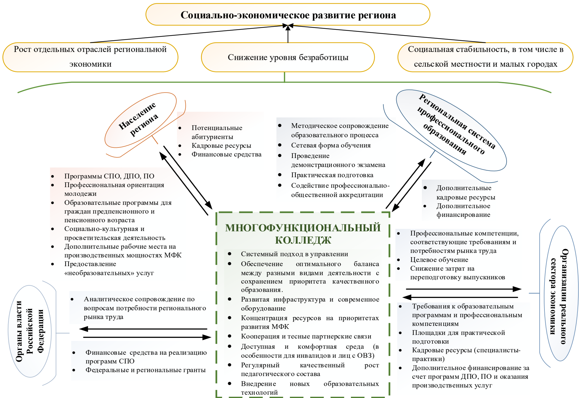
Рисунок 2. Целевая модель многофункционального колледжа