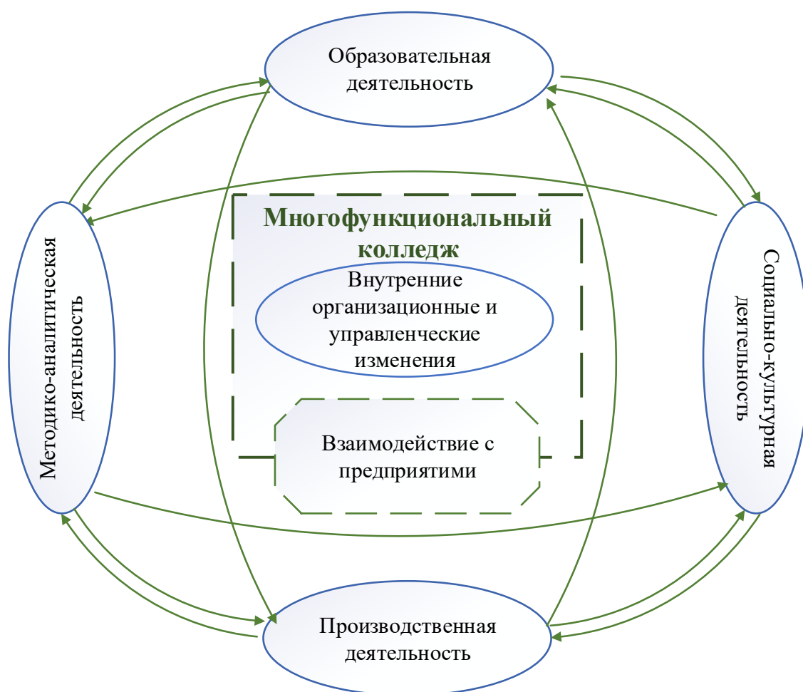
Рисунок 1. Виды деятельности многофункционального колледжа

Учитывая основные виды деятельности, реализуемые в многофункциональном колледже, и потребности ключевых заинтересованных сторон, деятельность многофункционального колледжа должна быть сконцентрирована в рамках следующих направлений: